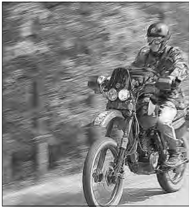
„Rausch der Geschwindigkeit“ von Alexander Häberlein

Im Rahmen des 25-jährigen Jubiläums des Foto- und Filmclubs Bechhofen ist nun die erste von mehreren geplanten Foto-Ausstellungen zu sehen. Im Schalterraum der VR-Bank Bechhofen, Dinkelsbühler Str. 7 ist eine Bilderwand mit Werken verschiedener