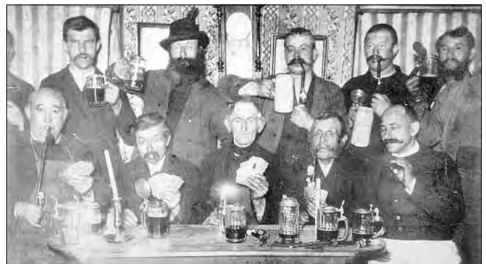
Wirtshausbild um 1900

Die Foto-Ausstellung „Bechhofen im Wandel der Zeit“ hat bisher viele Besucher angezogen. Deshalb wird der Ausstellungszeitraum um 3 Wochen bis zum 4. September verlängert. Zu besichtigen sind über 250 Bilder aus verschiedenen Epochen, die den Wandel im Ortsbild und in der Gesellschaft zeigen. Für die Besucher besteht auch die Gelegenheit Kommentare oder Informationen zu den Bildern ins Gästebuch einzutragen. Die Ausstellung kann während der Öffnungszeiten des Pinselmuseums besucht werden. Diese sind mittwochs und samstags von 14 - 17 Uhr und sonn- und feiertags von 13.30 - 17 Uhr.