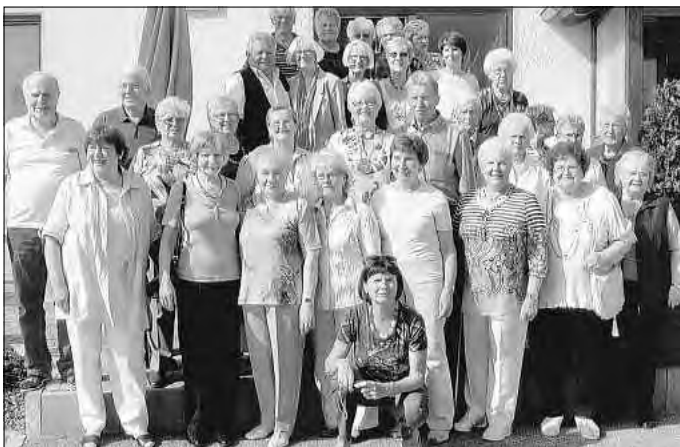
Die Teilnehmer des Voggendorfer Lagertreffens vor dem von Erich Bartoniek in Bechhofen gegründeten Gasthaus „Neue Welt“.

Zwar wird die Zahl der ehemaligen Bewohner des Flüchtlingslagers Voggendorf immer kleiner, dennoch hatten sich kürzlich über 30 davon zu einem „Lagertreffen“ in Bechhofen eingefun-